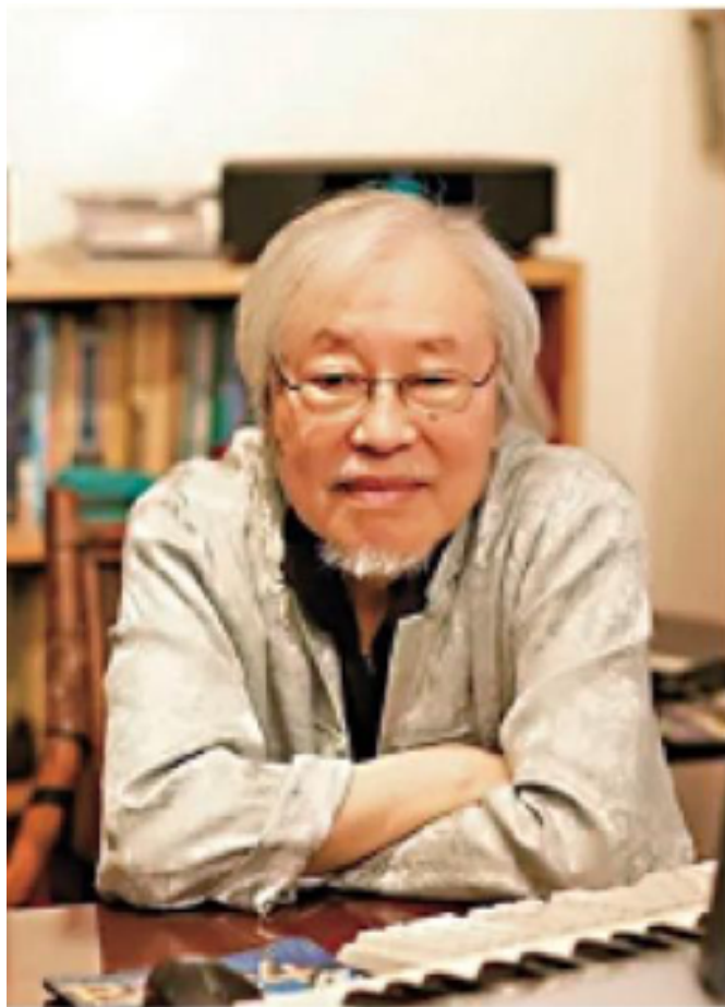
▲作曲家林樂培有「香港新音樂之父」之稱。